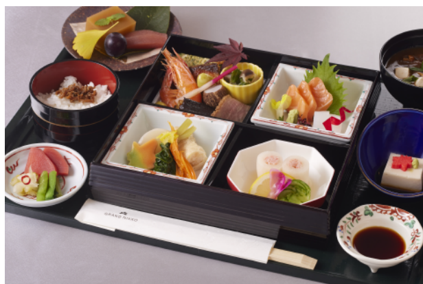
松花堂御膳 Set Meal of Shokado-style