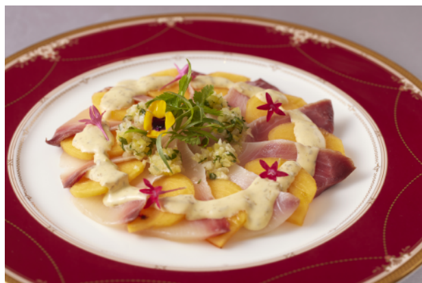
ブリヒラと柿のカルパッチョ仕立て Yellowtail Amberjack and Persimmon Carpaccio