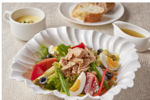
ニース風サラダ Nicoise Salad