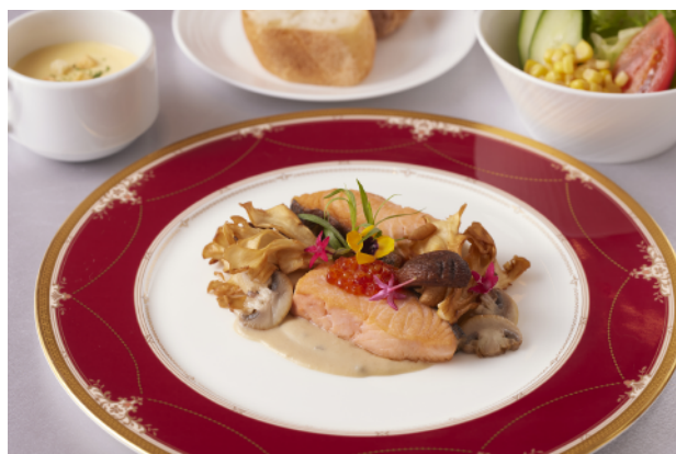
サーモンのソテー 秋の茸ソース Salmon Saute with Autumn Mushroom Sauce