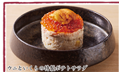
ウニといくらの特製ポテトサラダ