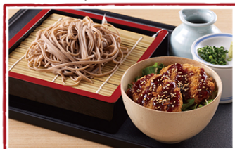
ヒレカツ小井セット