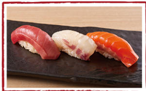
本日のおすすめ3貫