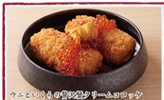
ウニといくらの贅沢蟹クリームコロッケ