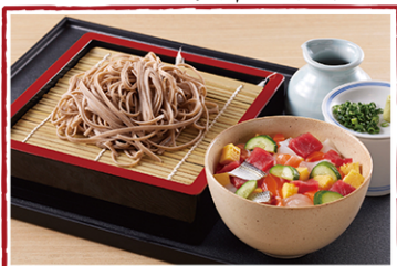
バラちらし小井セット