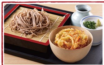
かき揚げ小井セット