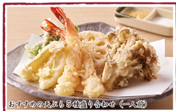
おすすめの天ぷら5種盛り合わせ (一人前)