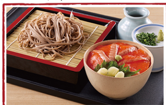
サーモン小井セット