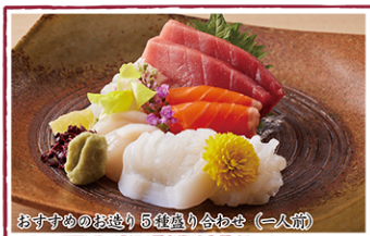
おすすめのお造り5種盛り合わせ (一人前)