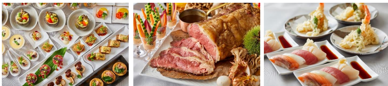
約 40 種類のメニューを取り揃えたランチbuffet

「ローストビーフ」、「握り寿司」、「天ぷら」をはじめ、シェフ選りすぐりの旬の食材を使用した洋食・和食・サラダ・デザートなど約 40 種類のメニューを心ゆくまでご堪能ください。