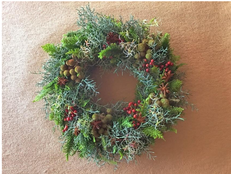
クリスマスリース完成イメージ

『グランドニッコー東京ベイ 舞浜』(所在地:千葉県浦安市、総支配人:藤本 千之)では、2020年12月7日(月)と12月10日(木)に、フレッシュなコニファーやヒバを使った香り豊かなクリスマスリース作りとホテルのランチbuffetが堪能できる、グランドニッコー東京ベイ 舞浜 プレミアムアカデミーVol.1『エルベ・シャトランのクリスマスリースレッスン』～ランチbuffet付き～を開催いたします。レッスンおよびランチbuffetは両日とも同内容となります。