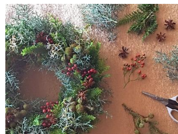
リースレッスンイメージ

【お問い合わせ】営業企画:047-711-2396(受付時間 10:00～17:00)