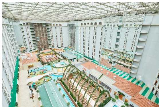
フロントやレストラン、チャペルなど、お客様がご滞在中に一度は立ち寄られる『アトリウム』(3階)