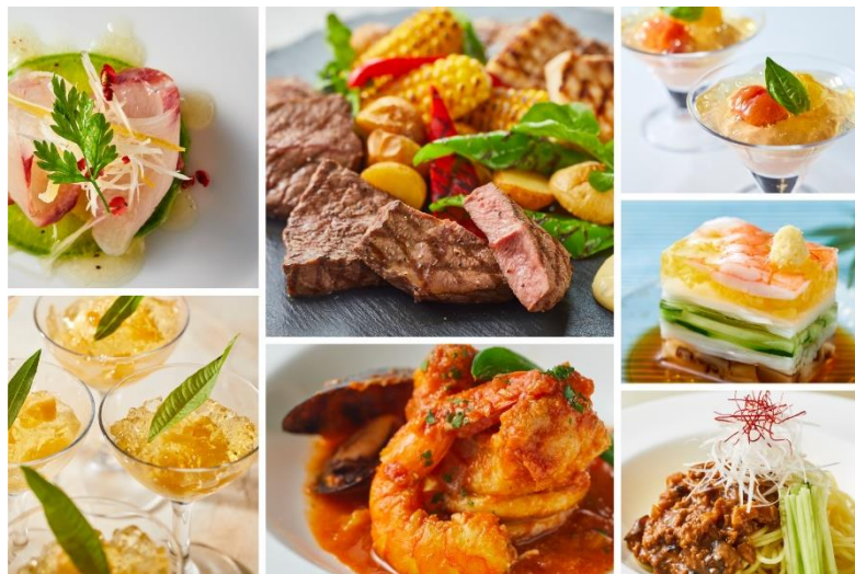
『安心オーダーブッフェ 夏のグルメフィエスタ』イメージ

グランドニッコー東京ベイ 舞浜(所在地:千葉県浦安市、総支配人:藤本 千之)では、オールデイダイニング「ル・ジャルダン」にて、グリル料理や夏野菜・フルーツをふんだんに使用したメニューを楽しめる『安心オーダーブッフェ 夏のグルメフィエスタ』を、2021年7月10日(土)から8月29日(日)の土・日・祝日に開催いたします。