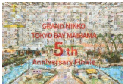
5th Anniversary モザイクアートパネル