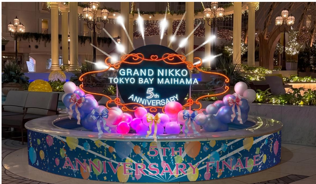
『5th アニバーサリー Thanks Finale』アトリウム装飾

◆『5th アニバーサリー Thanks Finale』詳細 https://tokyobay.grandnikko.com/news/478/