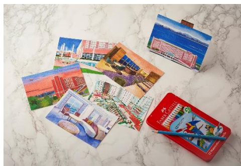
5周年メモリアルレターイメージ