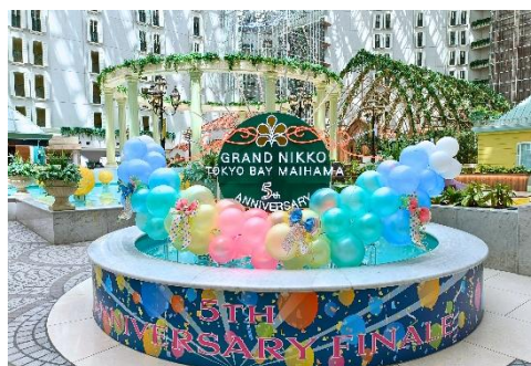
5周年記念モニュメント