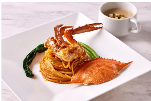
ランチアラカルトメニュー一例

第1部のプールをご利用のお客様には、オールデイダイニング「ル・ジャルダン」のすべてのランチアラカルトが一律1,800円に、また、第2部をご利用の方にはディナーブッフェが10%引きになるご優待券をお渡します。