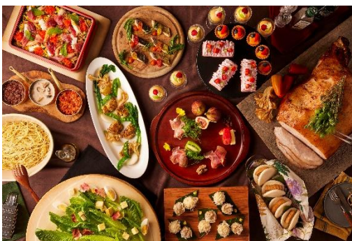
ディナーブッフェ