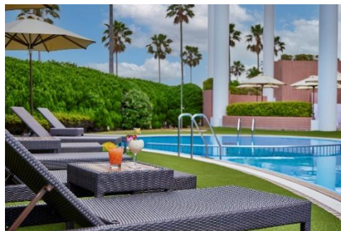
屋外プールサイド

7月18日(土)～8月31日(月)の期間は、併設のカウンターからフードやソフトドリンク、ノンアルコールカクテルなどを提供します。