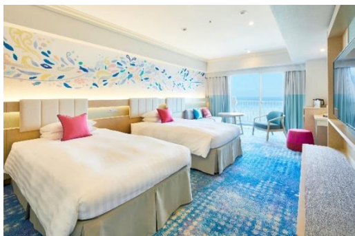
宿泊プラン客室一例

100種類以上の和洋メニューが楽しめるモーニングブッフェ付きのプランで、プールとホテルステイをお楽しみいただけます。